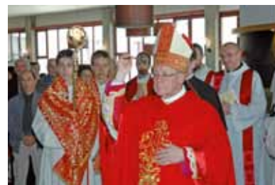
Patrozinium vom Heiligen Mauritius 40 Jahre