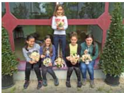
Minitreffen - Muttertag