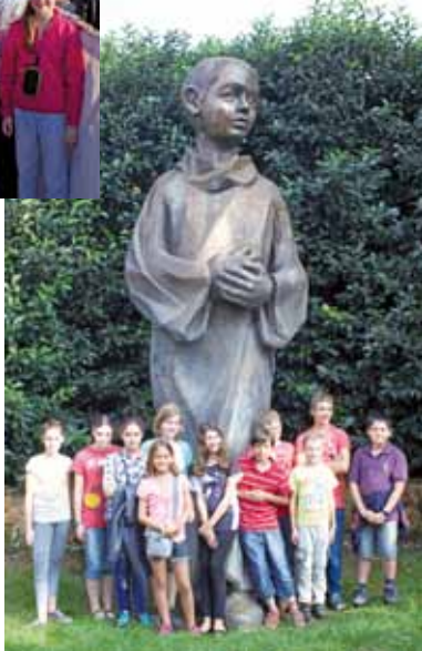
Heiliger Tarsisius, Patron der Ministranten